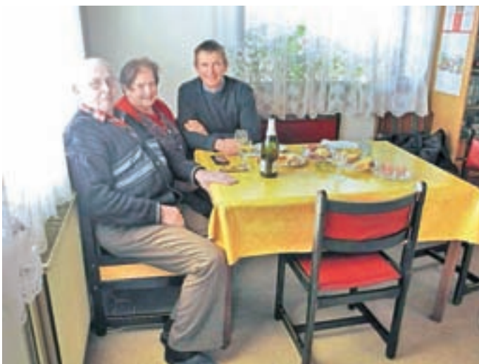
Slavila je tudi Lonca Šavs.