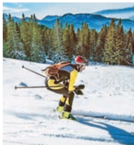
Proti cilju

Dogodek je mimo, zapomnili si bomo predvsem energijo, ki nas združuje! Tisti, ki ste priložnost izpustili, ste zamudili majhen delček življenja v družbi