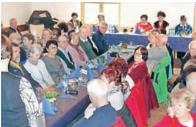
Z občnega zbora DU Jezersko