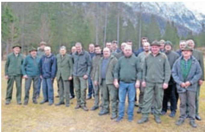
Člani LD Jezersko, udeleženci lova na štefanovo 2018

Lansko leto je bilo za prostoživečo divjad in tudi lovce, varuhe narave in prostoživečega živalstva, izjemno težko in uničujoče. Ko so se viharji in snežna neurja umirila, so lovci v zgodnjem spomladanskem času, ko se je sneg stalil, našli veliko poginule divjadi, kar je bila posledica orkanskih vetrovno-snežnih ujm, ki so uničevale gozd, lovske naprave in lovske steze. Poleg ostale divjadi so lovci našli čez dvajset poginulih gamsov, kar presega celotno predpisano kvoto za odlov gamsov. Koliko jih ni bilo najdenih, pa se ne da ugotoviti. Zaradi tega se je v dobro ohranjanja gamsove populacije LD kot dober izvajalec lovsko-upravljanjih obvez odločila, da se v letu 2018 lov na gamsa ne izvaja, saj je za to poskrbela že narava, žal z velikim presežkom.