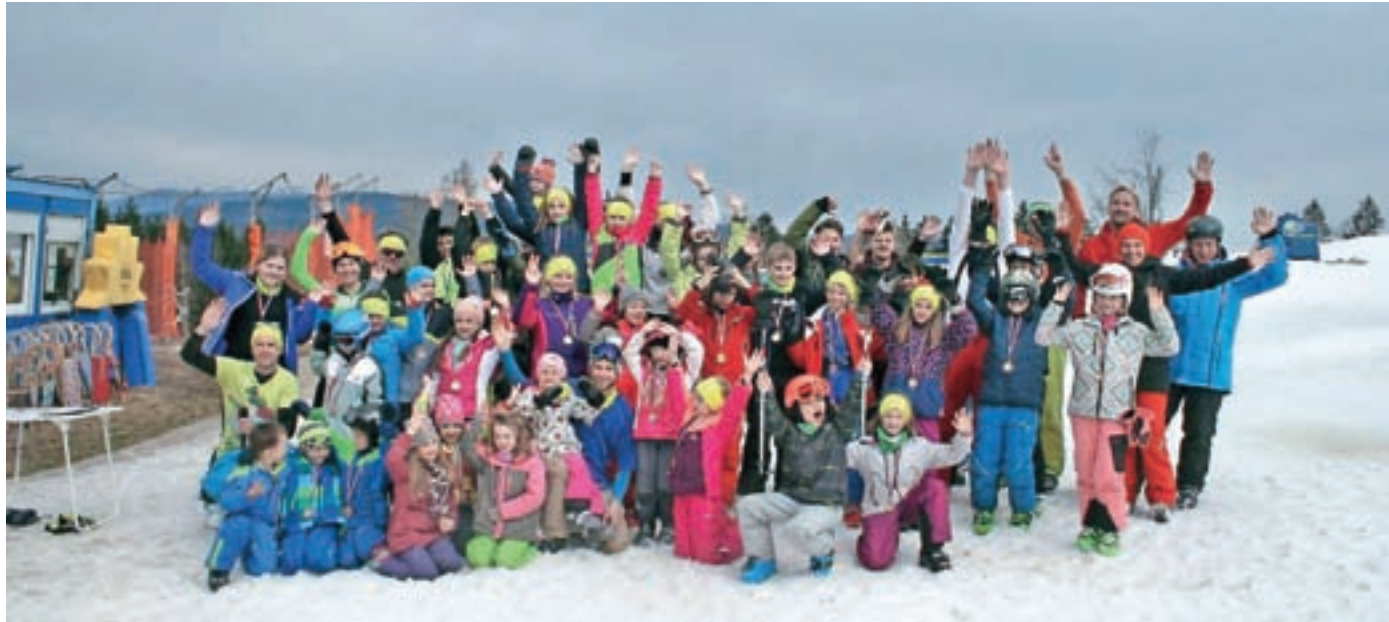
S smučanja na Peci